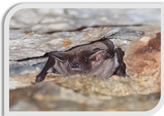
Figure 2 : Molosse de Cestoni et Vespère de Savi

Plusieurs espèces sont susceptibles de fréquenter les falaises, mais deux sont tout particulièrement inféodées au milieu rupicole, il s'agit du Molosse de Cestoni et du Vespère de Savi.